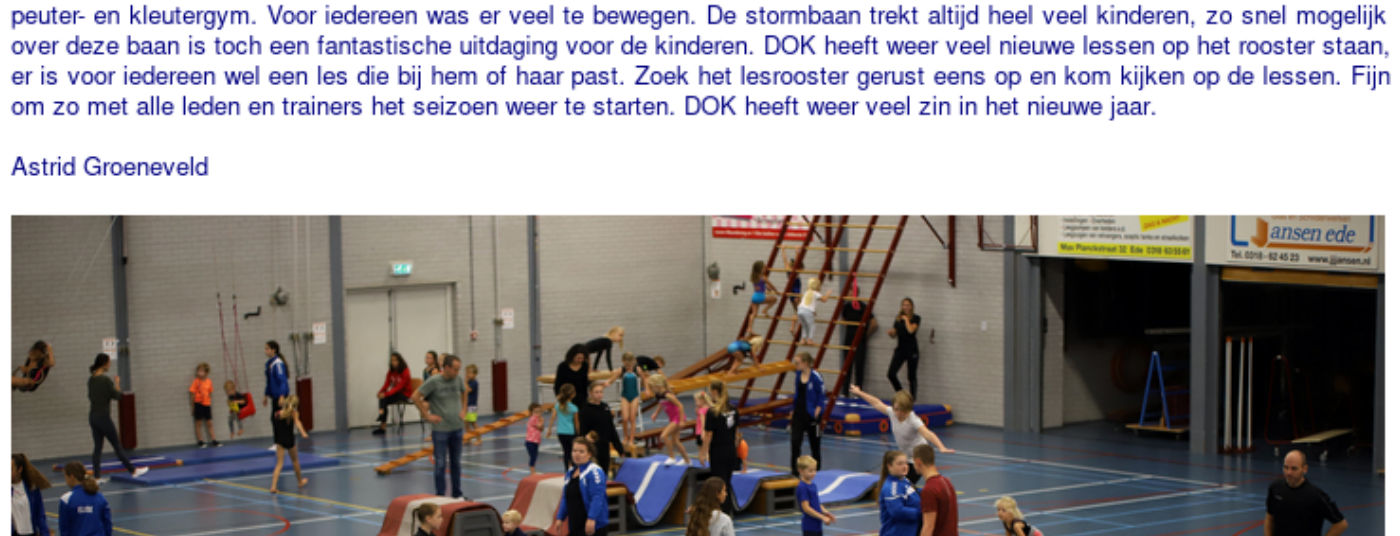
meer foto's staan op onze Facebookpagina www.facebook.com/DOK1922